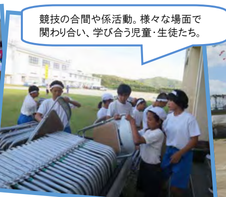
競技の合間や係活動。様々な場面で 関わり合い、学び合う児童・生徒たち。