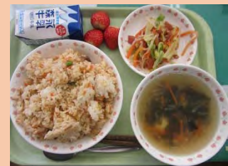
写真は昨年度のリクエスト給食です。