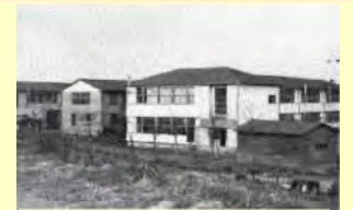
当時の大田区嶺町小学校