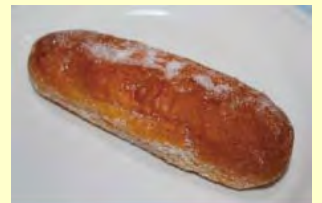
昔ながらの砂糖をまぶしたあげパン

東京あげパン http://www.agepan.jp/about-unoki.html